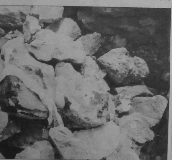
האבנים מוכסות דם קרוש, לידם מלנית צבאית ושרידי מוון צה"לי